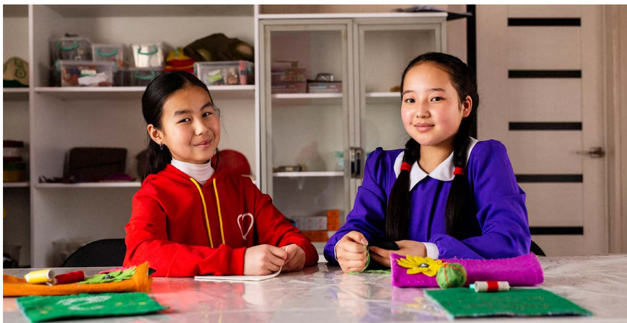
Deux filles - élèves des cours de broderie de Zhamilya, Barskoon, Kirghizistan, 2021