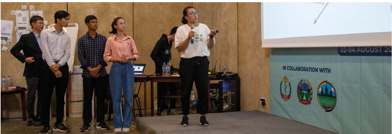
Le Défi Hackathon d'innovation pour sensibiliser à la RAM au Cambodge s'est tenu en août 2023 et était le premier dans la région du Pacifique occidental. Son objectif était de fournir à 20 étudiants universitaires les connaissances et les outils nécessaires pour développer des campagnes de communication innovantes visant à modifier les comportements. Cette nouvelle initiative a été conçue pour cultiver les champions de la RAM chez les jeunes et les jeunes adultes, qui dominent les médias sociaux et sont experts dans l'utilisation des nouvelles technologies pour faire entendre leur voix. Cambodge, 2023

Lorsque vous concevez votre rapport d'impact, faites attention au style !