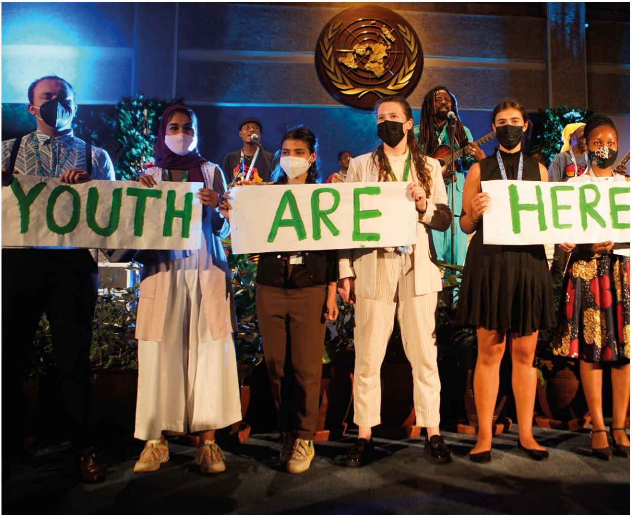
L'ambassadeur de bonne volonté du PNUE Rocky Raggae avec un groupe de jeunes à l'UNEA 5.2, Nairobi, 2022

Il est parfois plus efficace de créer de nouvelles opportunités de plaidoyer que d'attendre un changement. Les groupes de jeunes devraient être guidés dans le choix des rôles et la prise de responsabilités, y compris les postes politiques élus et nommés.