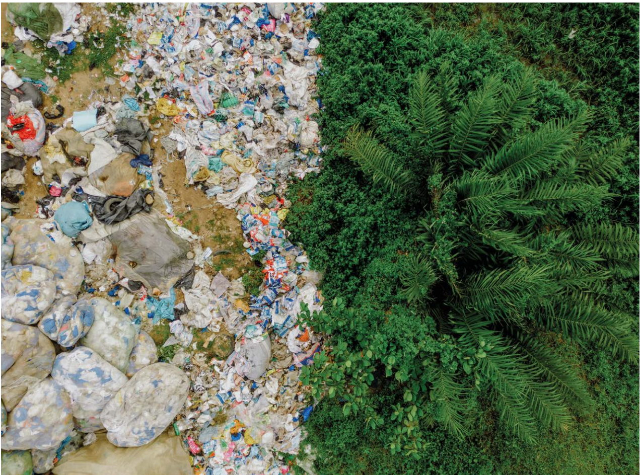
La pollution plastique étouffe notre planète, 2022

La sensibilisation du public à l'utilisation des antimicrobiens dans la collectivité X est insuffisante, car aucun effort n'a été produit pour fournir des ressources axées sur la collectivité à l'usage du public.