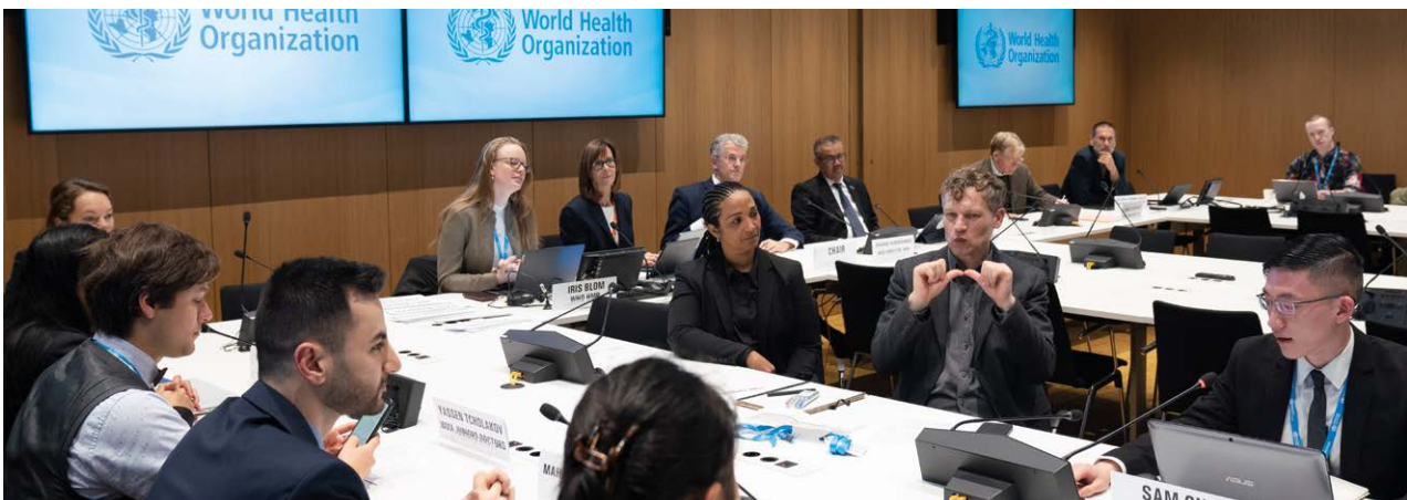
Réunion inaugurale du Conseil de la jeunesse de l'OMS, 27 janvier 2023. L'OMS a accueilli la réunion inaugurale du Conseil de la jeunesse de l'OMS du 27 au 30 janvier 2023 au siège de l'OMS à Genève (Suisse). Le Conseil de la jeunesse de l'OMS est un réseau dynamique visant à amplifier les voix et les expériences des jeunes et à tirer parti de leur expertise, de leur énergie et de leurs idées pour promouvoir la santé publique. Il travaillera avec des jeunes et des organisations de jeunes du monde entier pour créer un mouvement de jeunes en faveur de la santé. Suisse, 2023