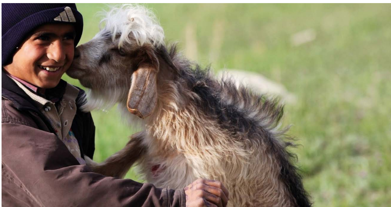
Un enfant et sa chèvre s'embrassent amicalement au Moyen-Orient, année inconnue