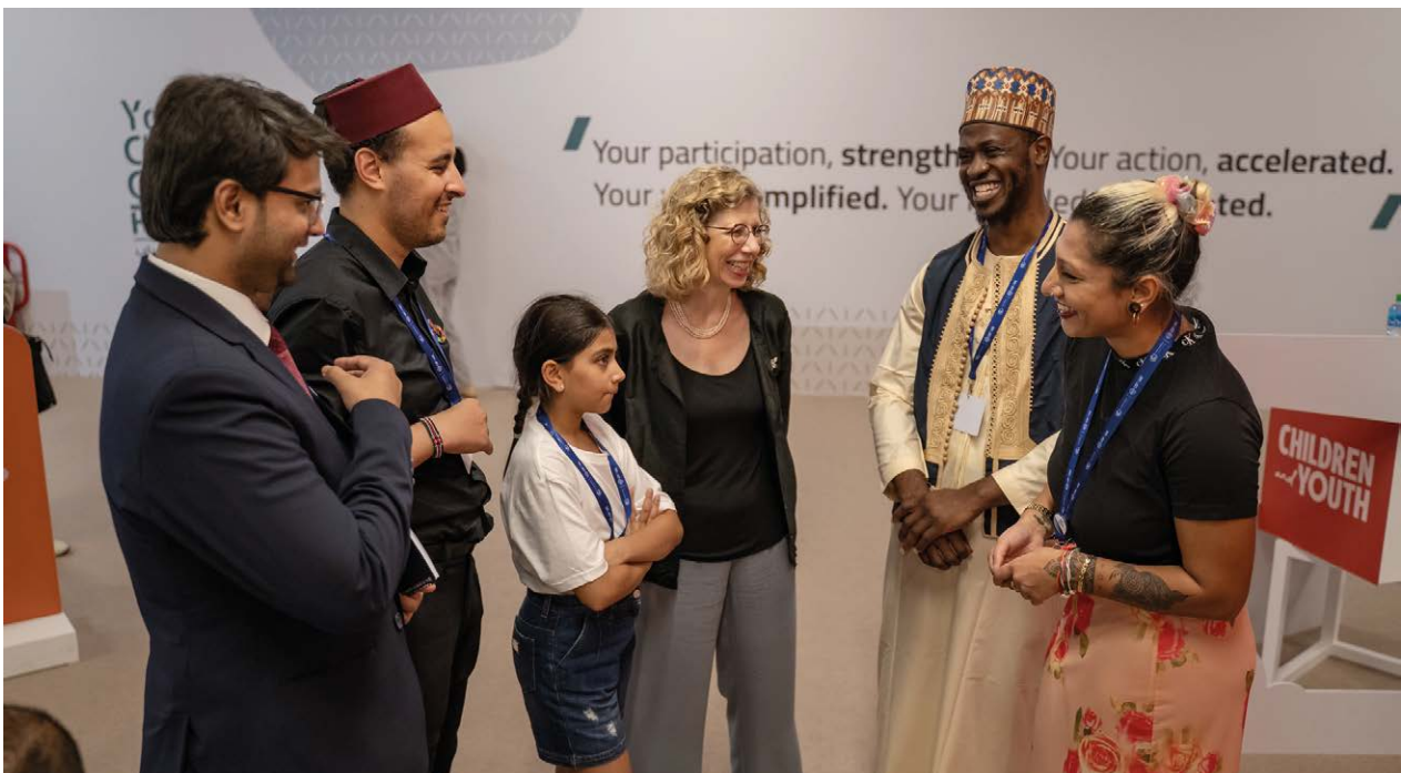
Inger Andersen, directrice exécutive du PNUE, s'entretient avec une délégation de jeunes lors de la COP28 sur le climat, Dubaï, 2023