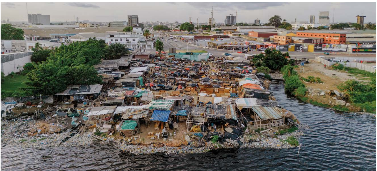
Les rivières, les lacs et les sédiments peuvent être des sources transitoires de RAM, 2022

Renforcez la collaboration avec les universités et les instituts de recherche locaux afin d'étoffer le corpus d'éléments probants de votre projet, notamment en comblant les lacunes constatées.