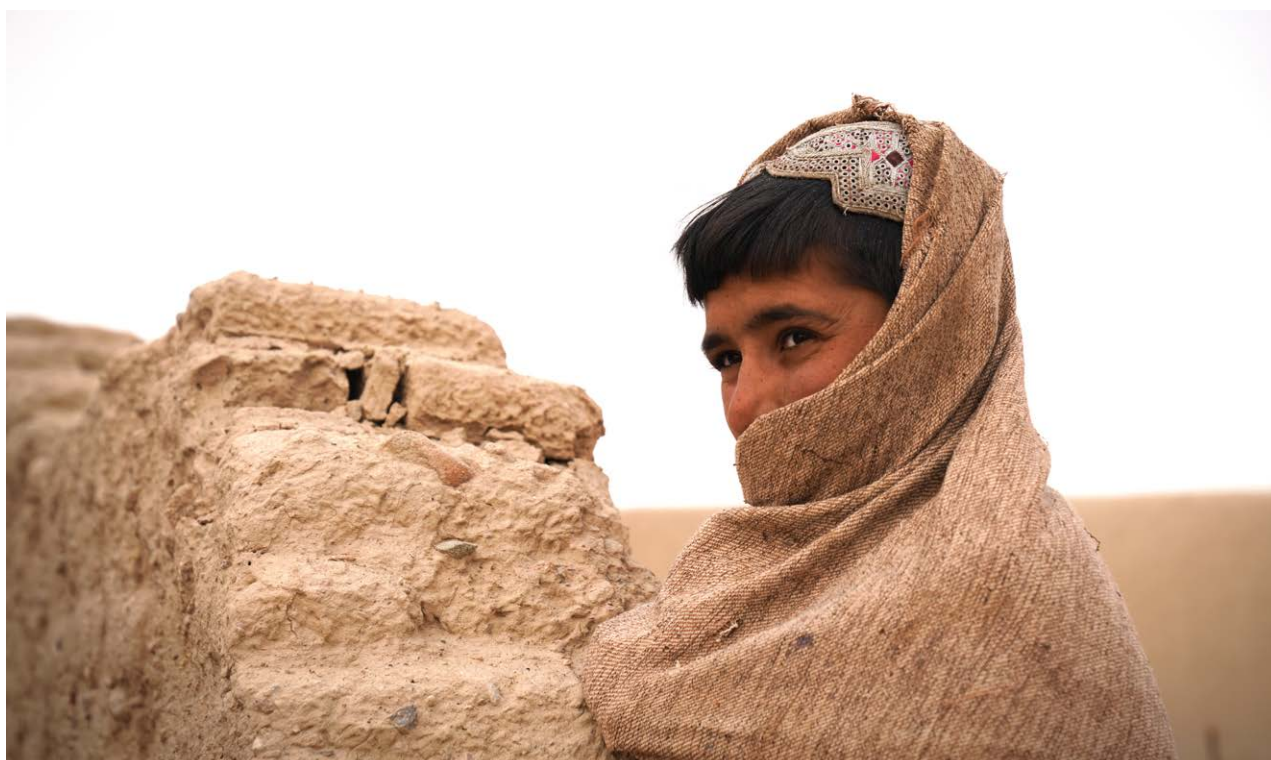
Vue de profil d'un jeune garçon dans le district de Daman à Kandahar, province de Kandahar, Afghanistan, 2024

On parle de RAM lorsque les bactéries, les virus, les champignons et les parasites ne répondent plus aux médicaments antimicrobiens. En raison de la résistance aux médicaments, les antibiotiques et autres traitements antimicrobiens se révèlent inefficaces et les infections deviennent difficiles, voire impossibles à traiter, ce qui accroît le risque de propagation de maladies, le risque de maladies graves, d'invalidité et de décès (3). Les infections résistantes aux médicaments ont non seulement un impact sur la santé des animaux et des plantes, mais elles réduisent également la productivité et peuvent menacer la sécurité alimentaire (1).