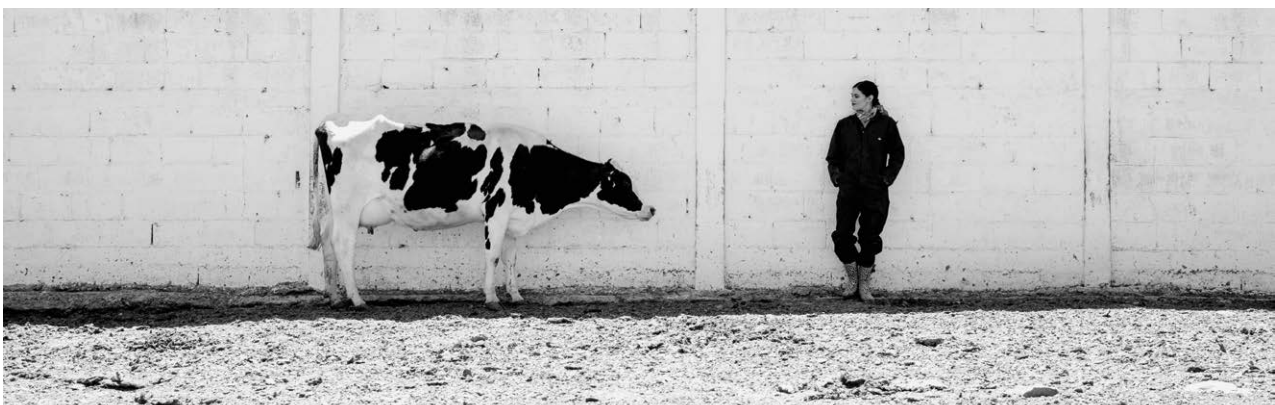
La confiance d'une productrice de lait au Mexique, 2019