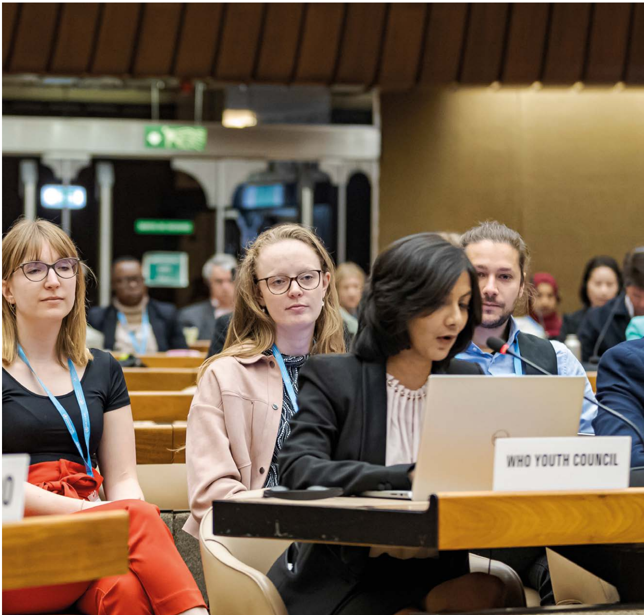
Soixante-dix-septième Assemblée mondiale de la santé, Genève, Suisse, 27 mai - 1er juin 2024. Table ronde stratégique « Changement climatique et santé : une vision globale pour une action commune » lors de la 77e Assemblée mondiale de la santé le 1er juin 2024 à Genève, Suisse, 2024 ©OMS / Antoine Tardy.