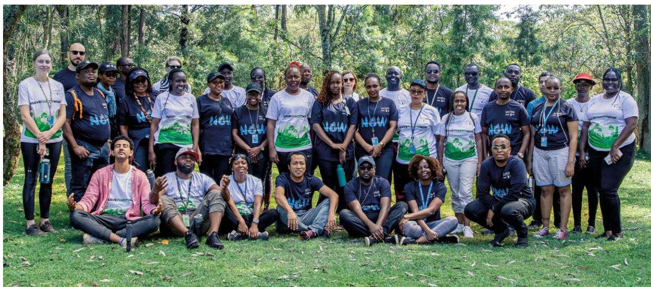
Pour commémorer la Journée internationale des forêts, une partie de l'équipe du PNUE a visité la forêt de Karura à Nairobi (Kenya) pour une randonnée informative autour de la forêt avec le Service forestier du Kenya, Nairobi, Kenya, 2024