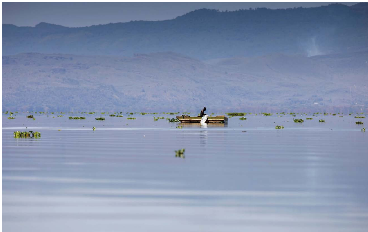
Les antimicrobiens peuvent être utilisés dans les systèmes d'aquaculture ouverts et fermés, Lac Naivasha, Kenya

Essayez de nouvelles façons d'entrer en contact avec votre public. Par exemple, si votre approche initiale consistant à utiliser des vidéos et des infographies sur des plateformes de médias sociaux comme YouTube, Instagram et TikTok n'a pas atteint la persona X, vous pourriez passer à des histoires vécues et à des témoignages de survivants de la RAM (voir section 5.1 ).