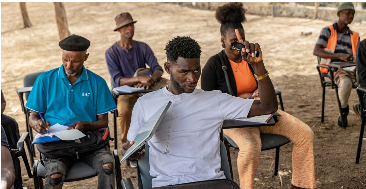
Un jeune homme lève la main lors d'une session de formation dispensée par des experts de la FAO Chine à l'intention des agriculteurs et des éleveurs de bétail du Cap-Vert, dans le cadre du Programme de coopération Sud-Sud (CSS) de la FAO Chine à l'appui des systèmes agroalimentaires au Cap-Vert, Cap-Vert, 2024

Conclusion : Le symposium My Turn a mobilisé les étudiants de l'enseignement supérieur pour relever les défis posés par la RAM en Ouganda. Les contributions créatives ont montré l'engagement des étudiants dans la lutte contre la RAM, la nécessité d'un travail soutenu, d'une collaboration plurisectorielle et d'une sensibilisation accrue du public pour atténuer la RAM.