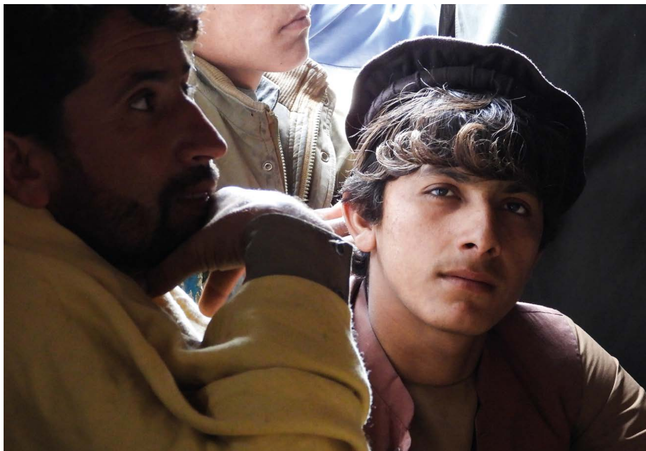
Portrait d'un jeune garçon dans le district de Lal Pur, Jalalabad, Afghanistan, 2022