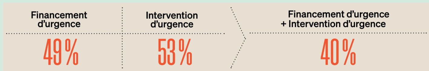
Source : missions PVS d'évaluation ou d'évaluation de suivi pour 43 Membres, 2016-2021 – Analyse du stade d'avancement pour les compétences critiques II-9. et II.6. de la 6e édition de l'Outil PVS

Sur la base des récentes missions du Processus d'évaluation de la Performance des Services vétérinaires (PVS), le pourcentage des Membres qui ont atteint ou dépassé la capacité minimale est le suivant :