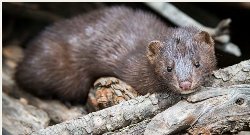
Vison d'Amérique (Hinton, Alberta)

* Pour plus d'informations sur les signes cliniques, voir la section 4. Certains animaux ont été infectés par le SARS-CoV-2 sans présenter de signes cliniques. Par conséquent, il peut arriver qu'un ou plusieurs animaux asymptomatiques soient testés sur la base d'un jugement clinique vétérinaire et/ou de santé publique.