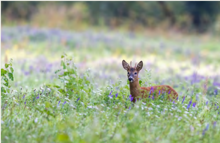
Cerf de Virginie

L'objectif de l'étude doit être clairement défini et doit guider sa conception. Des plans d'étude adaptés sont nécessaires, par exemple, pour notamment : détecter la présence, chez les animaux, d'une infection chez des individus ou au niveau d'une population ; estimer la prévalence de l'infection ; évaluer la possibilité de persistance de l'infection au niveau d'une population.